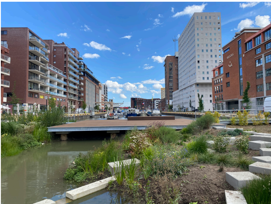
Figuur 1: Waterland realiseert: In Leuven Vaartkom creëerde we een mini-biotoop (watertuin en drijvende eilanden) die inspelen op de lokale watercondities, midden in de stad.

Zo versnellen we de transitie naar een Vlaanderen waar proper, voldoende en beleefbaar water de norm is.